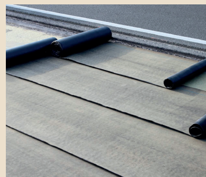
Guaina bituminosa ad L