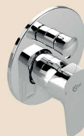
Miscelatore doccia Ideal Standard serie Ceraplan