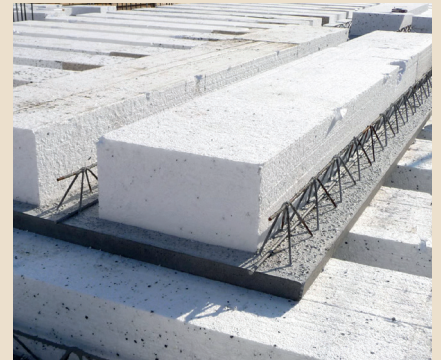
Solai interpiano in predalles gettato in opera