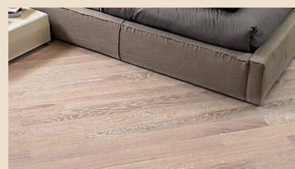
Pavimento delle camere con listelli in legno prefinito in rovere