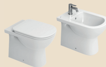
Sanitari a pavimento Dolomite Gemma 2