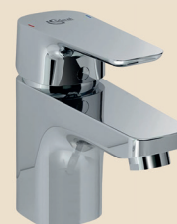
Miscelatore lavabo Ideal Standard serie Ceraplan 3