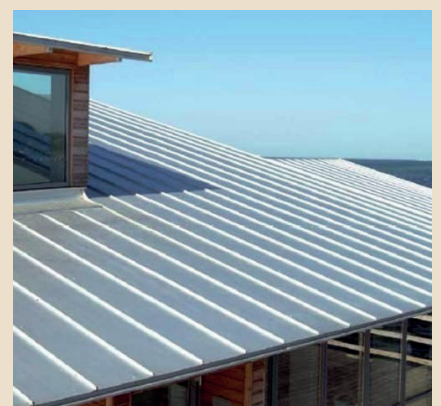
Manto di copertura in erba sintetica o su falde inclinate di lamiera *