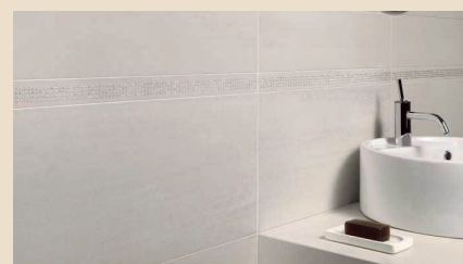
Rivestimento pavimento e pareti dei bagni