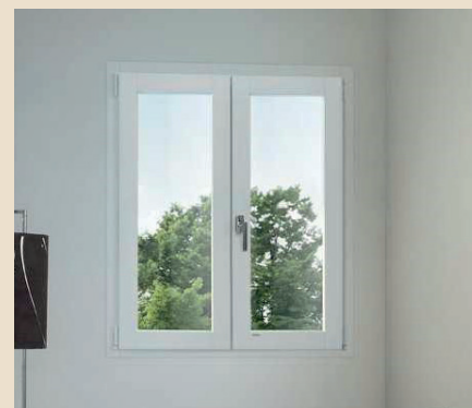
Serramenti in PVC