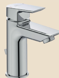
Miscelatore lavabo Ideal Standard serie Ceramix