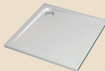
Piatto doccia Ideal Standard serie Ultraflat