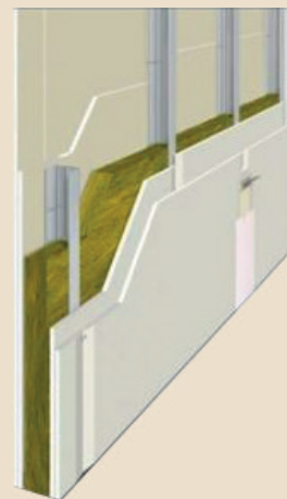
Sezione parete divisoria interna