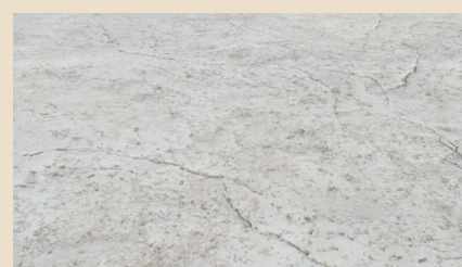
Pavimentazione monolitica in cls stampato