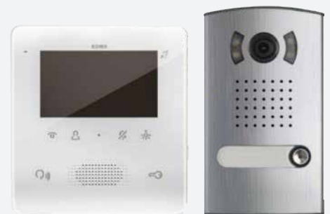
Impianto videocitofono Vimar Tab Free 4.3