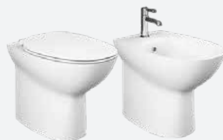
Sanitari sospesi Rak Morning