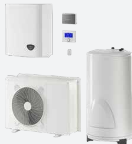
Pompa di calore ad aria/acqua della ditta Ariston/Aermec

I - Non verrà eseguito nessun impianto per il gas, in quanto l'impianto di riscaldamento sarà in pompa di calore ed il piano cottura sarà a induzione.