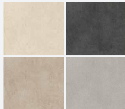
Piastrelle in monocottura o in gres porcellanato, formato cm 60x60