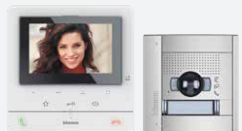
Impianto videocitofono Bticino