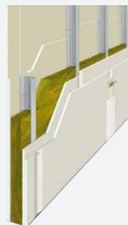
Sezione parete divisoria interna