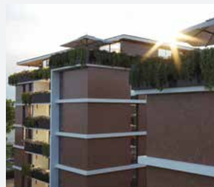
Tinteggiatura esterna su cornici in lavabile al quarzo