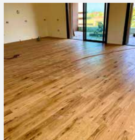
Listelli in legno prefinito in rovere