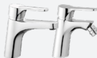
Miscelatore lavabo e bidet

3 - L'apertura dei contattori enel e/o acqua condominiali, accensione dell'ascensore se presente da progetto, verrà effettuata dall'amministratore condominiale e non dalla società Venditrice, precisando che tutte le spese di start up del fabbricato, saranno ripartite tra i vari futuri acquirenti indistintamente dalla data del rogito di compravendita.