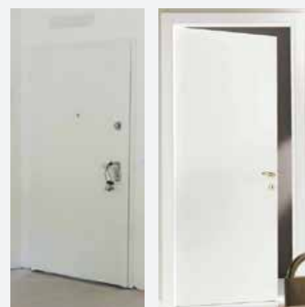
Portoncino interno e porta interna