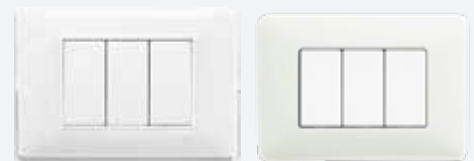
Frutti Vimar Plana oppure Bticino Matix